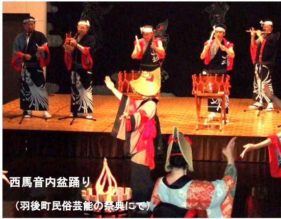
西馬音内盆踊り (羽後町民俗芸能の祭典にて)