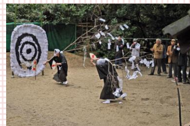
宰領人が踊る伊勢音