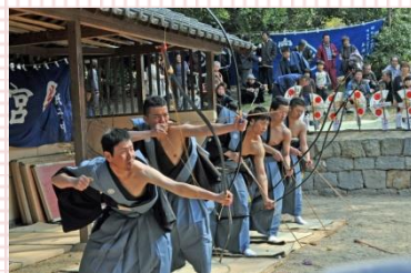
射手による弓射の様

また、生里ももて祭をはじめ三豊市内で県・市の指定を受けている15の無形民俗文化財の保存会にとって、日々の活動の励みになるとともに、全国に「三豊市の『生里のモモテ』」として知られるきっかけになると期待しています。